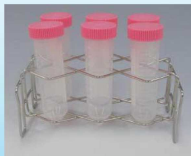
隣のチューブと干渉しません。