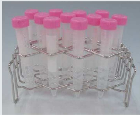
15mL コニカルチューブ (12本立)