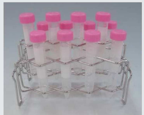
15mL コニカルチューブ 段差付き (12本立)