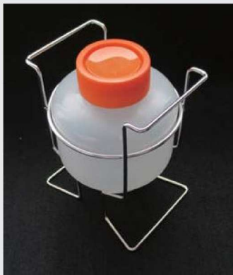
500mL コニカルチューブ