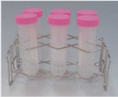
50mL コニカルチューブ (6本立)