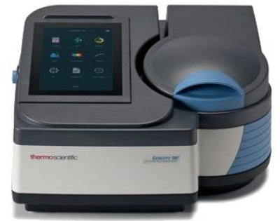
GENESYS 140 GENESYS 150 GENESYS 180 Biomate 160