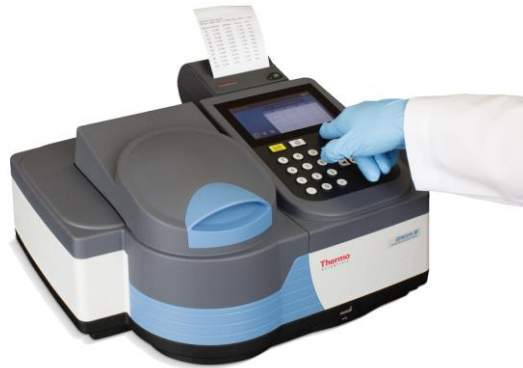
オプションで内蔵プリンターが搭載可能