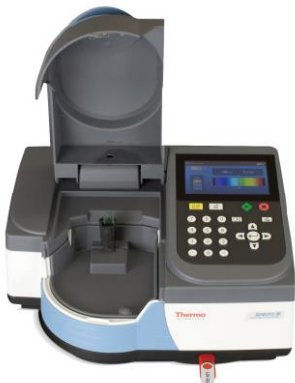
大きなサンプルコンパートメントは サンプルのハンドリングが容易です。