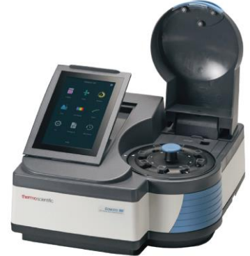
GENESYS180は自動8セルチェンジャー標準搭載