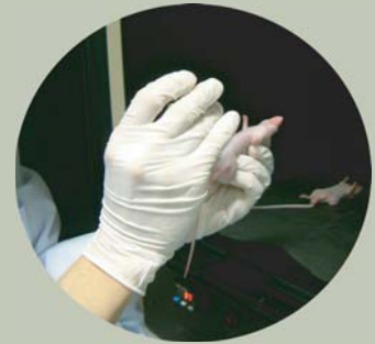
麻酔をかけたヌードマウスにルシフェリンを注射